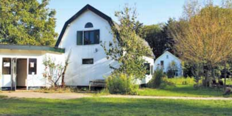
Landgoed Kraaybeekerhof in Driebergen